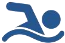
СШОР по водным видам спорта