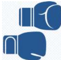
СШОР по боксу