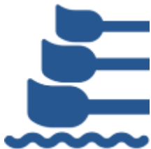
СШОР по гребному спорту