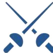
СШОР по фехтованию имени Г.И. Шварца