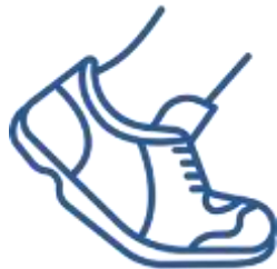
СШОР «Надежда Губернии»