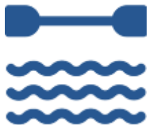
СШОР по гребле на байдарках и каноэ

На обновление материально-технической базы спортивных школ области в 2020 году выделено 15,8 миллионов рублей