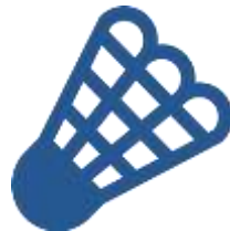
СШОР «Олимпийские ракетки»